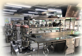
烘焙丙級檢定考場