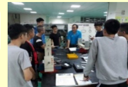
業界專家 協同教學