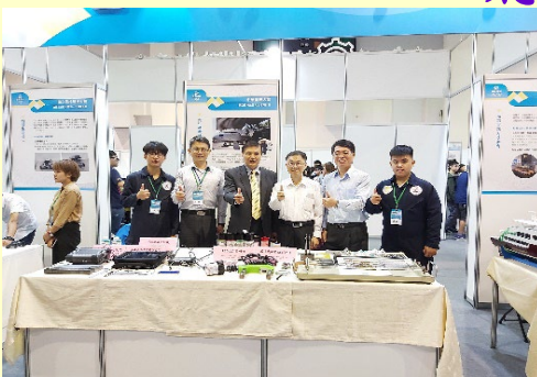
教育部「優化實作環境計畫」 「航空維修人才培育中心」 參展「優化技職前瞻未來」