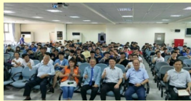
業界專家演講 接軌業界實務