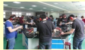
強化實作課程 提升專業技能