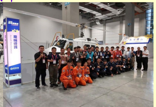
勞動部46~47屆國際技能競賽國手培訓基地 2020~2023連續承辦飛機修護全國技能競賽