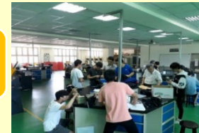
飛修證照 術科輔導