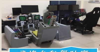
飛機自動駕駛實驗室