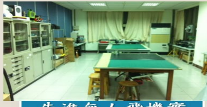
先進無人飛機實驗室