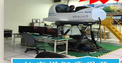
航空模擬應用發展中心