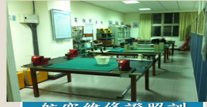
航空維修證照訓練教室