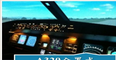
A320全單式飛行模擬機