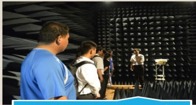
電磁相容與天線量測實驗室